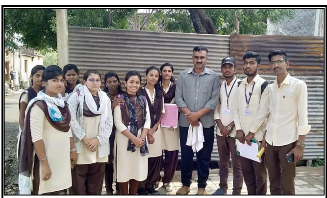
Students with citizen Latur on the occasion of Voter Awareness Program